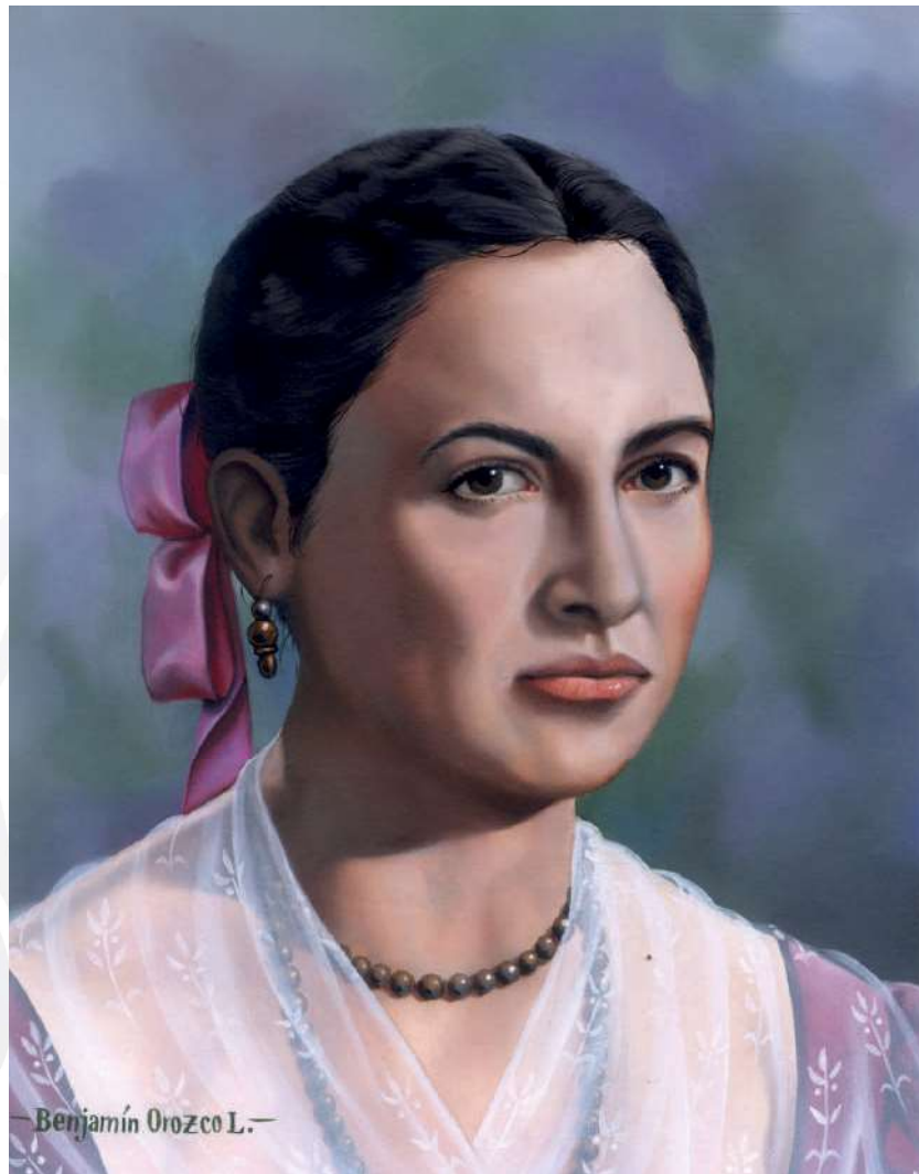
Benjamín Orozco. Gertrudis Bocanegra, ilustración sobre board, 2007.