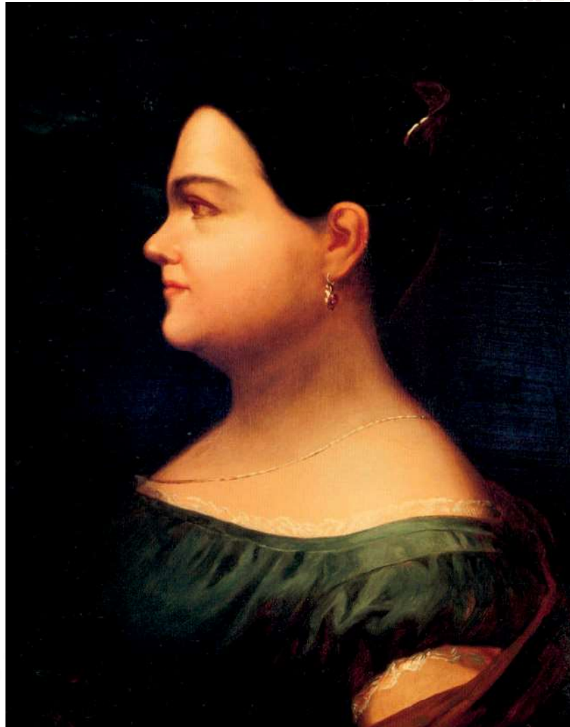
Anónimo, Leona Vicario, óleo, siglo XIX. Museo Nacional de Historia-Castillo de Chapultepec. INAH-Secretaría de Cultura.