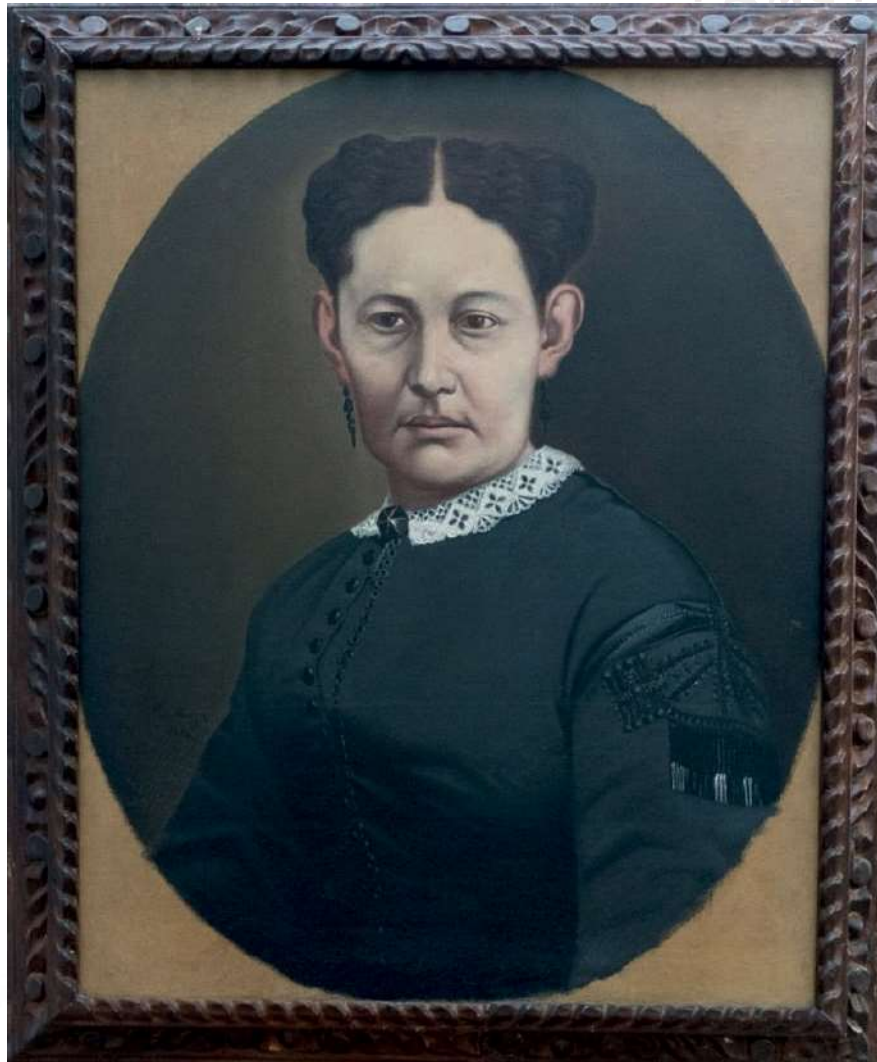
Retrato de Margarita Maza de Juárez, Autor no identificado, pintura de caballete, Museo de Sitio Casa Juárez. Instituto Nacional de Antropología e Historia. Secretaría de Cultura.