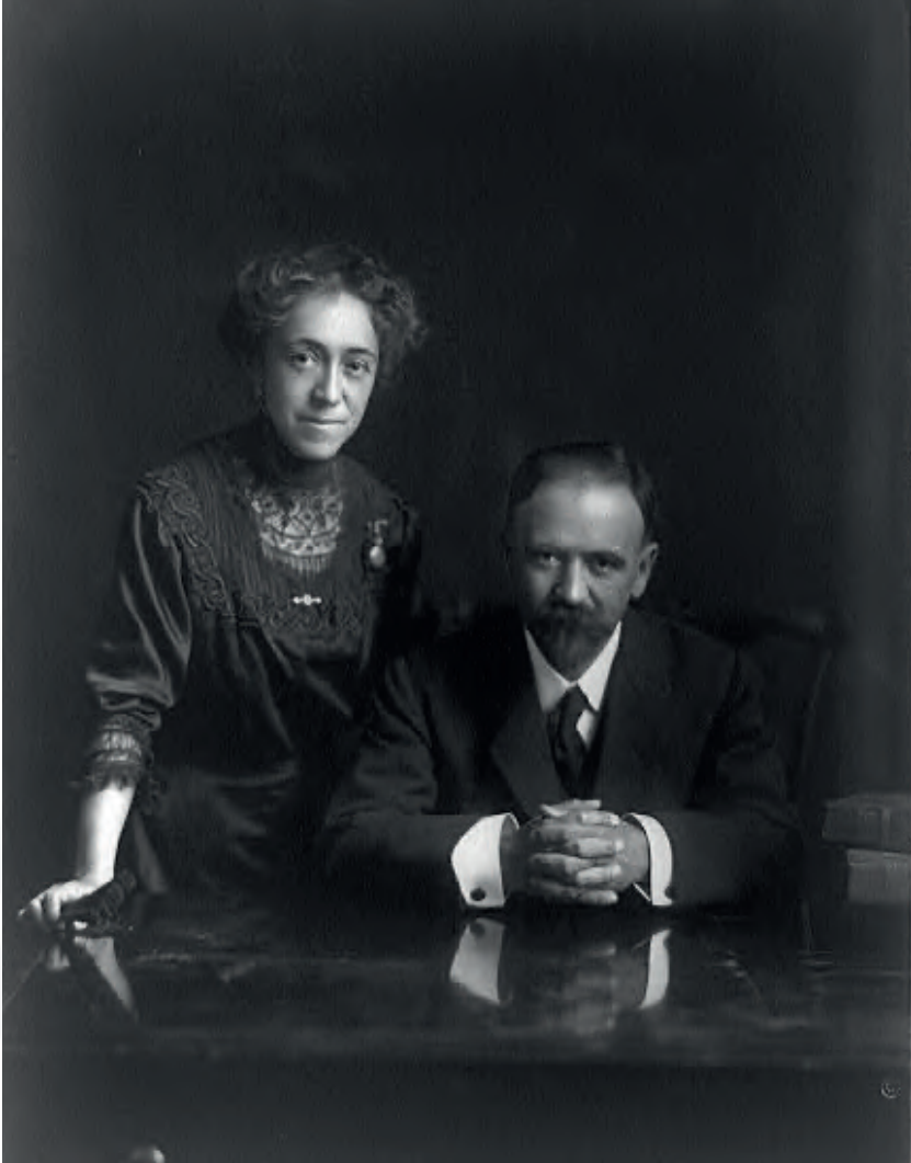
Francisco I. Madero y Sara Pérez, 12 de junio de 1911.