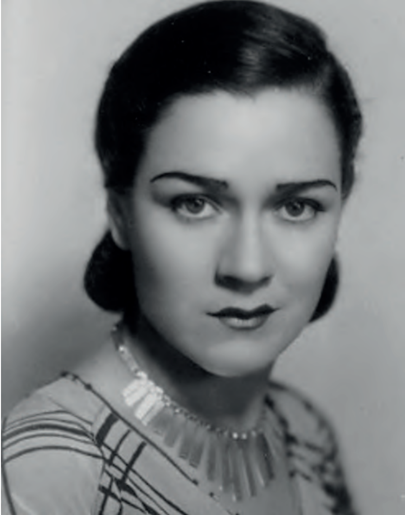
"Nellie Campobello", bailarina, ca. 1940.