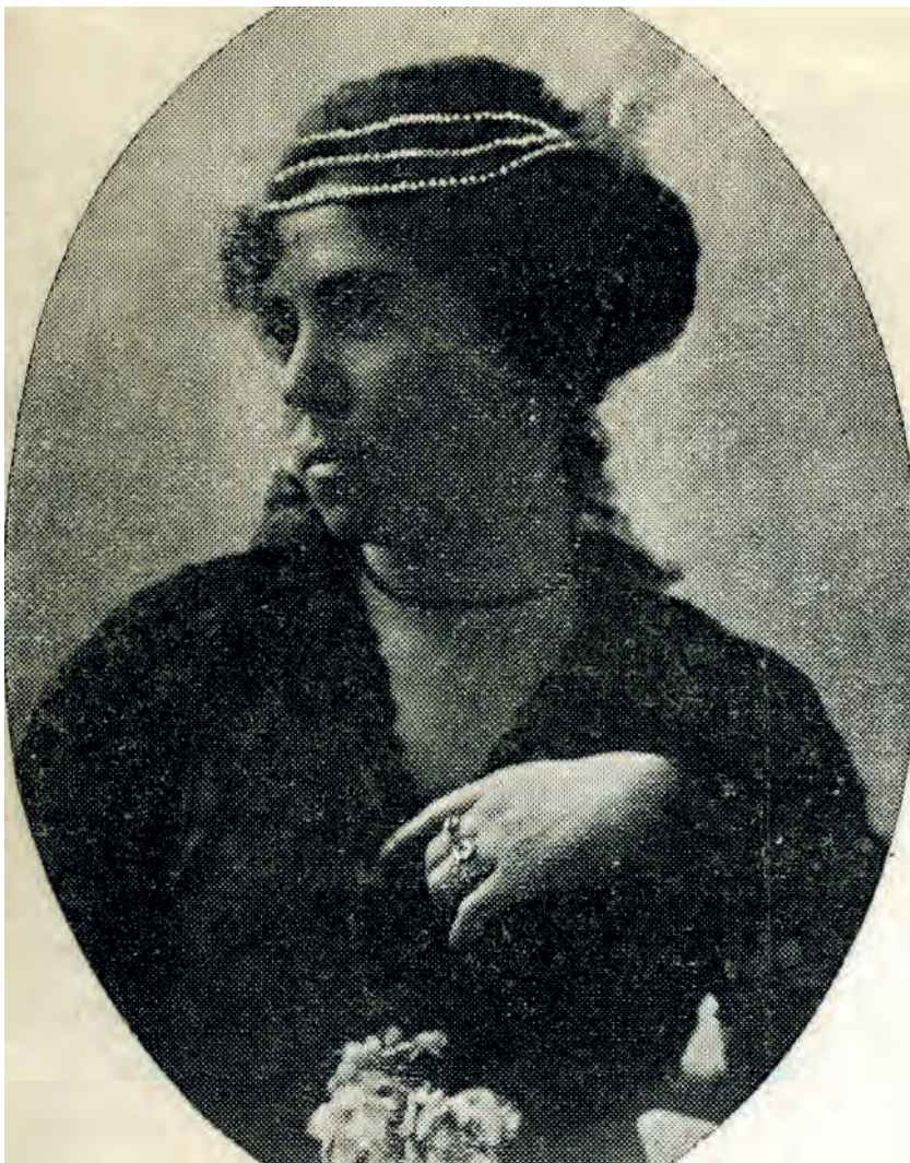
Retrato de Hermila Galindo Acosta. Exposición "70 años del Voto de la Mujer", INEHRM - INMUJERES.