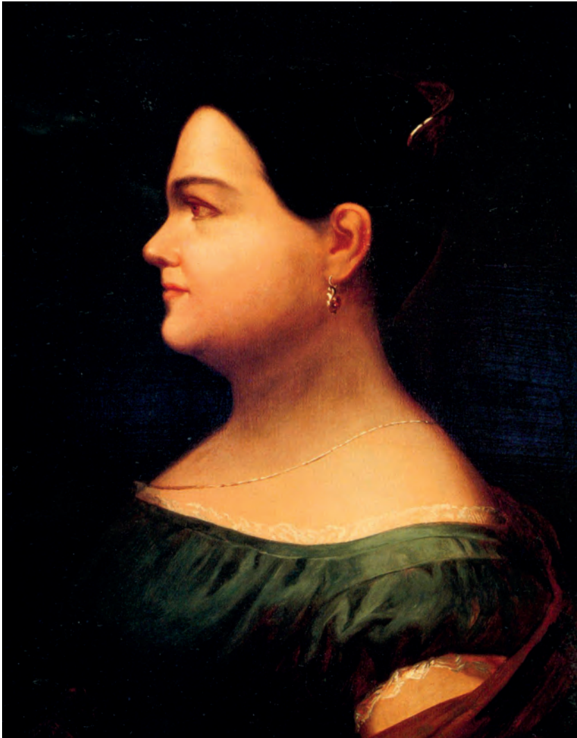
Anónimo, Leona Vicario, óleo, siglo XIX. Museo Nacional de Historia-Castillo de Chapultepec. INAH-Secretaría de Cultura.