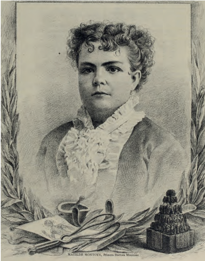
Obra Anónima, Matilde Montoya, Primera Doctora Mexicana, 1887, Álbum de la Mujer, México, 4 de septiembre de 1887.