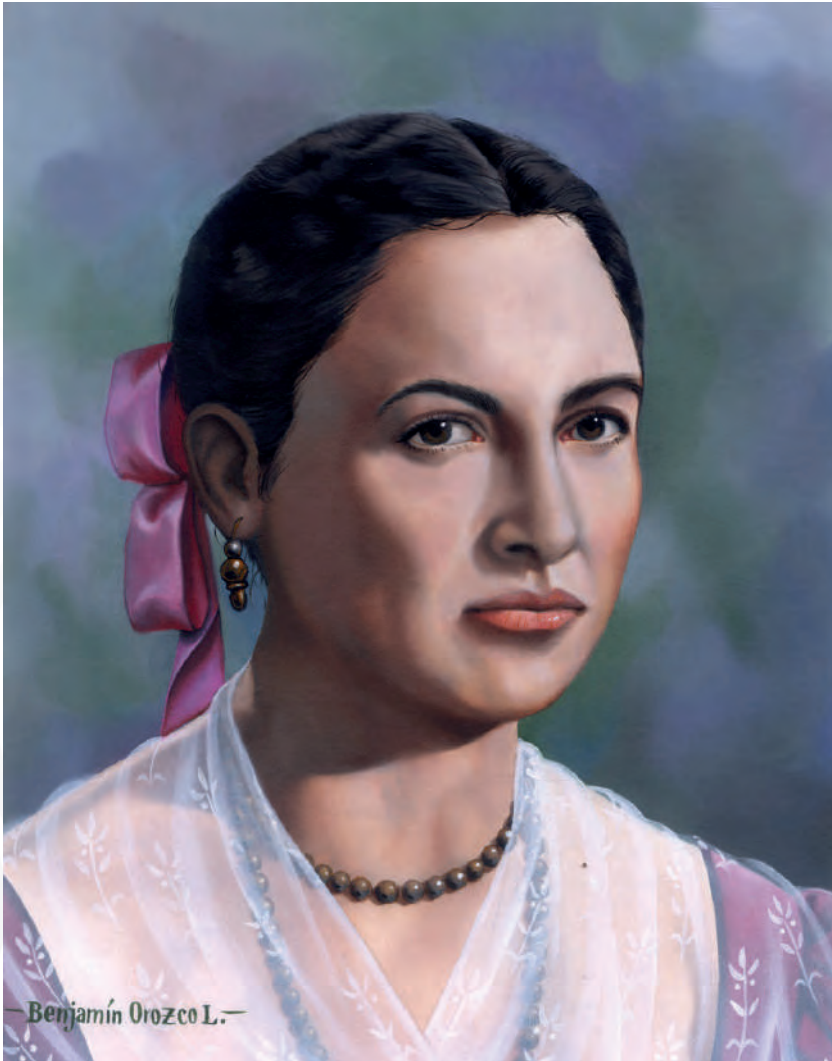
Benjamín Orozco. Gertrudis Bocanegra, ilustración sobre board, 2007.