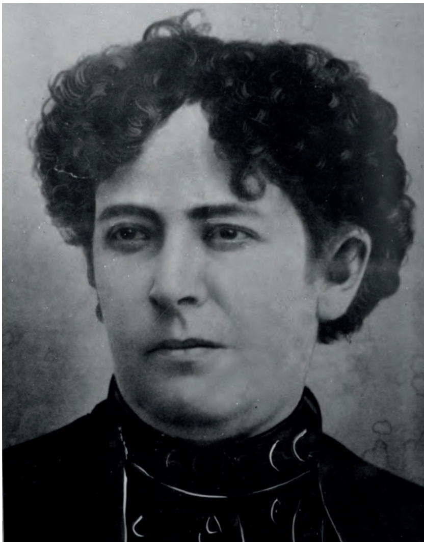
Dolores Jiménez y Muro, periodista revolucionaria, retrato, ca. 1900, © (18905), México, Secretaría de Cultura - INAH - Sinafo - FN.