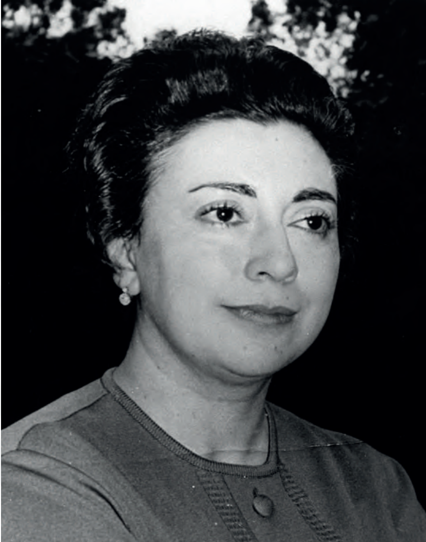
Rosario Castellanos, ca. 1955.