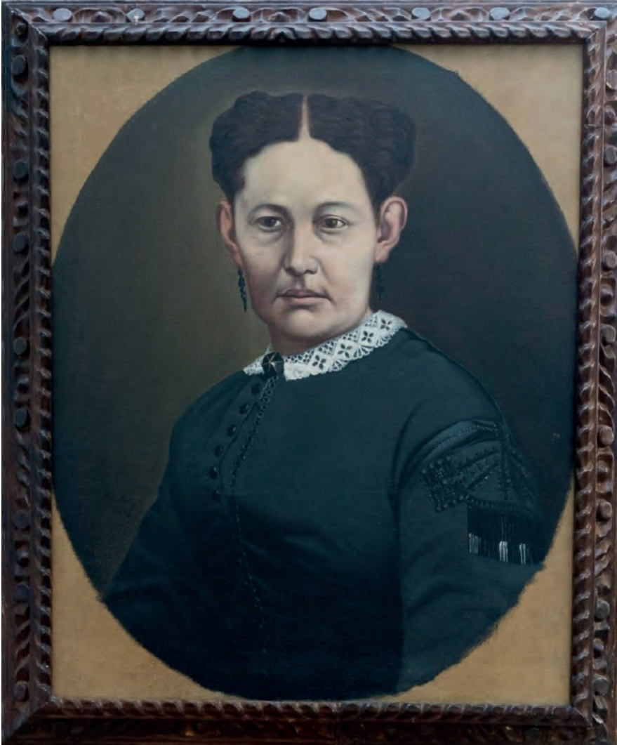
Retrato de Margarita Maza de Juárez, Autor no identificado, pintura de caballete, Museo de Sitio Casa Juárez. Instituto Nacional de Antropología e Historia. Secretaría de Cultura.