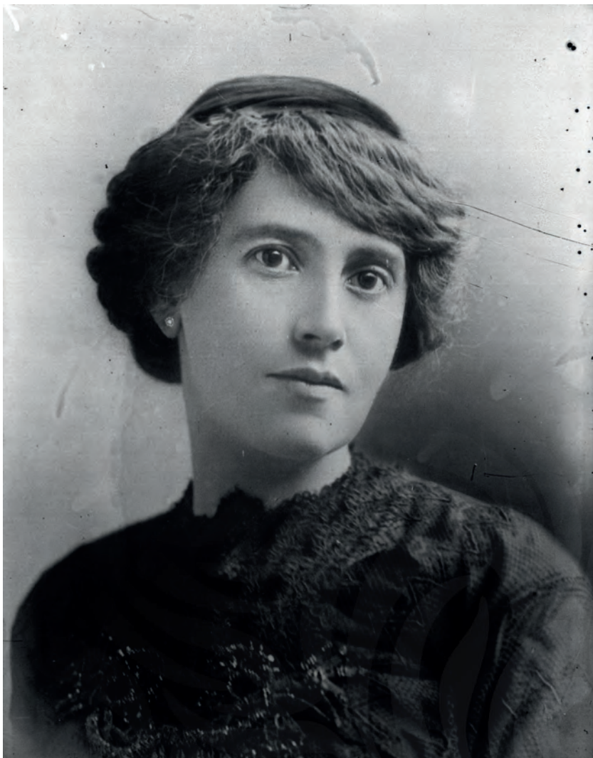
Carmen Serdán, retrato, ca. 1900, © (66712), México, Secretaría de Cultura - INAH - Sinafo - FN.