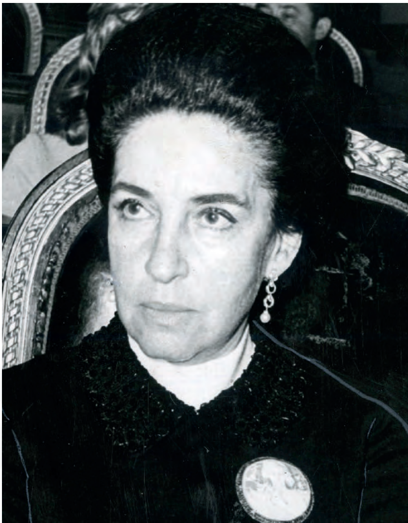
La senadora Griselda Álvarez Ponce de León. 14 de febrero de 1977.