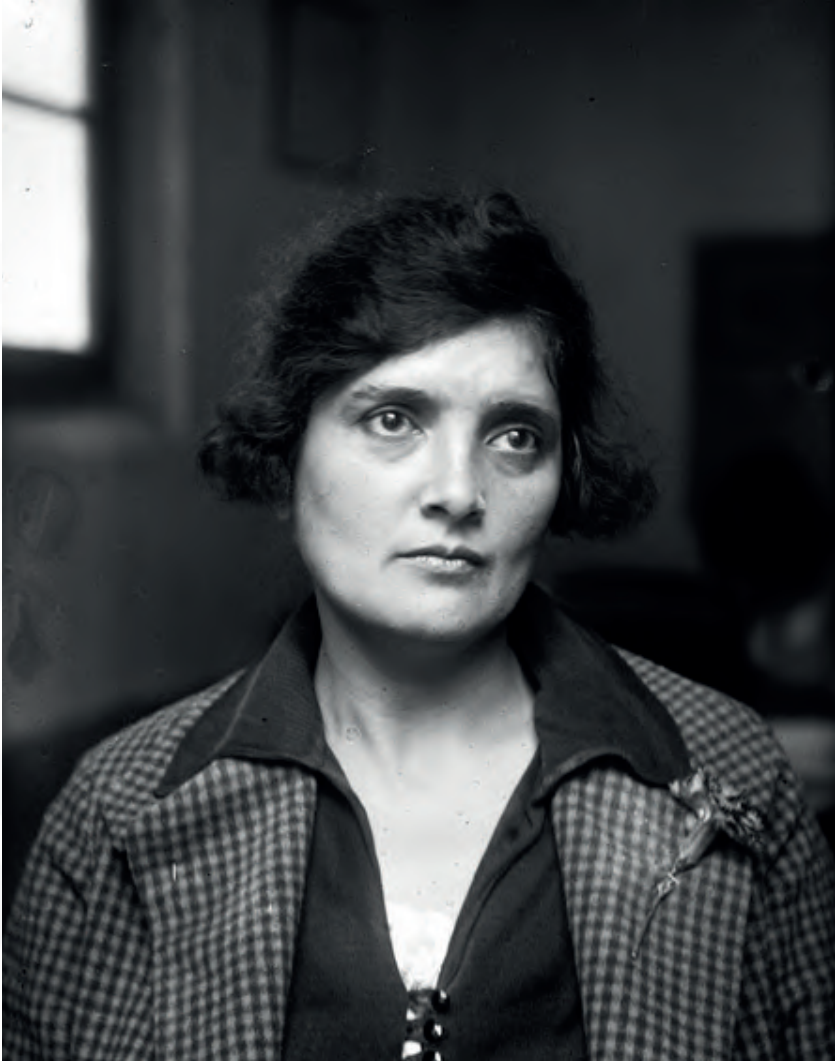
Elvia Carrillo Puerto, ca. 1920.