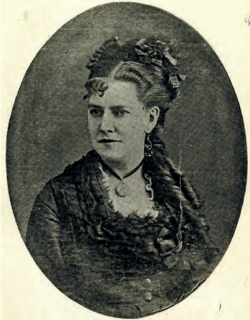
Retrato de Laureana Wright.