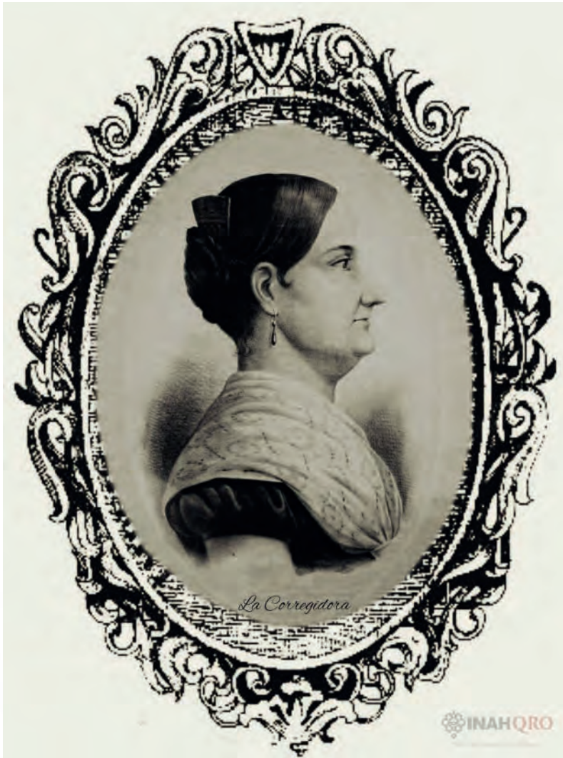
Retrato de Josefa Ortiz. Centro INAH Querétaro.